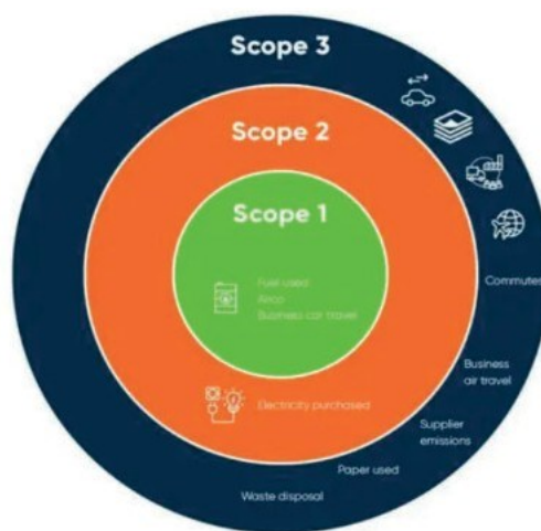
Pilt 1. Mõjualade 1, 2 ja 3 heited. Infograafik: Anthesis Group.